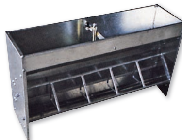
▲N-2型 (Type) B