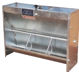
▲N-1型 (Type) B