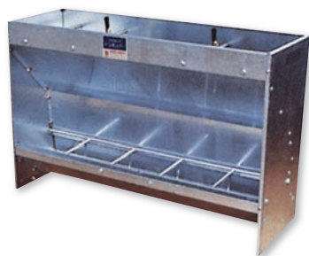
▲N-5型 (Type) B