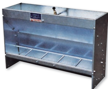
▲N-3型 (Type) B