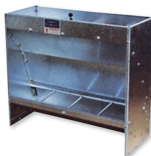
▲N-4型 (Type) B