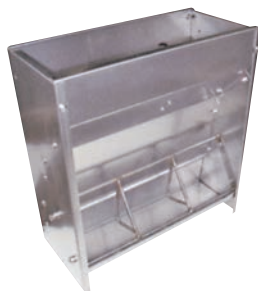
▲N-1型タテ型 (Type) B