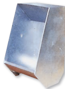
▲N-6型 (Type) B 丸底型 Round Bottom