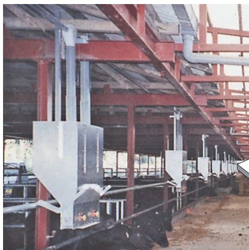
▲ビーフホッパーNK29-60・F-75型 1ラインシステム