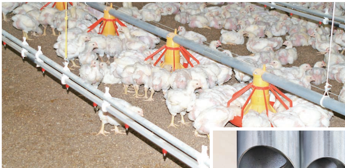
▲パンフィーダーLL・F-50型