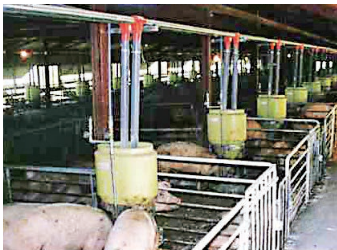
▲NH-R600型・F-50型2ラインシステム