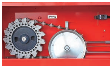
▲ドライブユニット内・C-50型