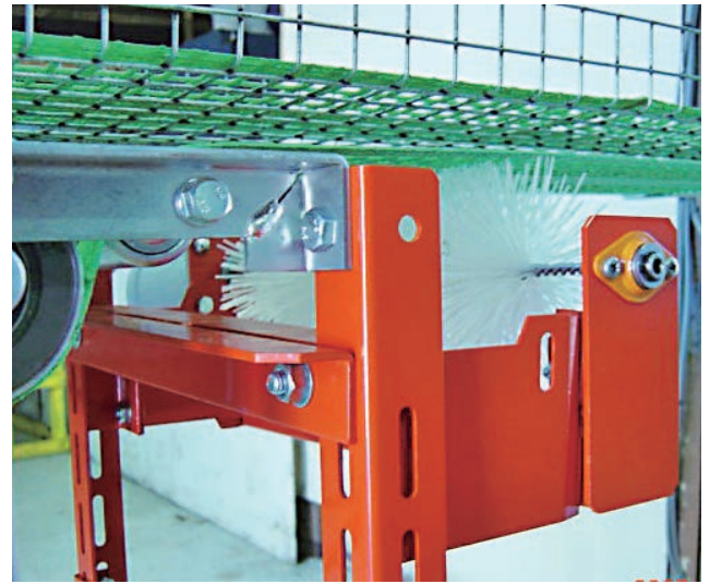
▲ベルトクリーナー(オプション)