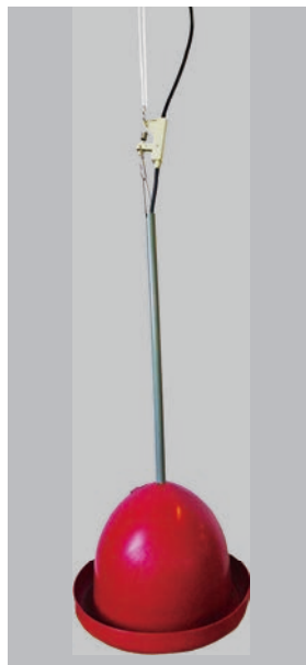
▲白バルブ (オアシス)