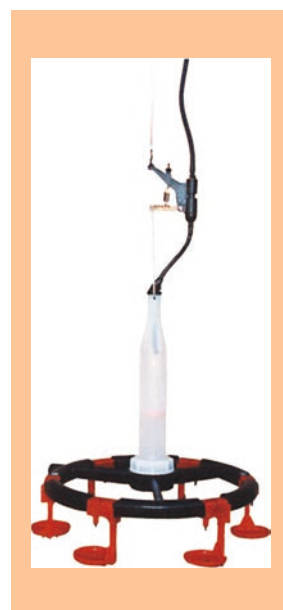
▲黒バルブ (サンウォーター)