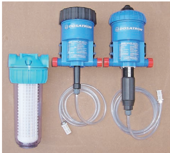
▲フィルター ▲D-100R ▲D-25RE-2(5)