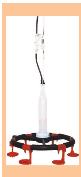
▲白バルブ (オアシス)