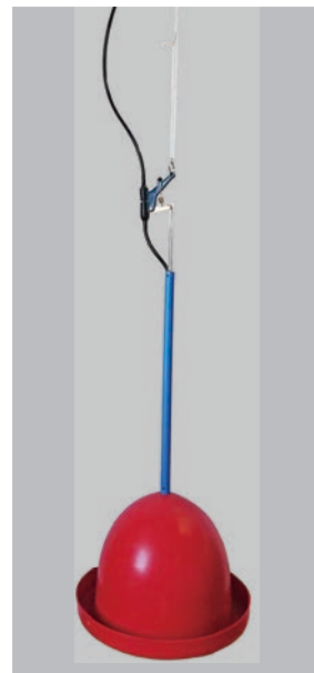
▲黒バルブ (サンウォーター)