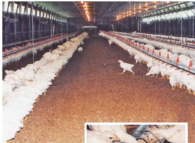
▲ケーブルフィーダー OC-60型（育成用）