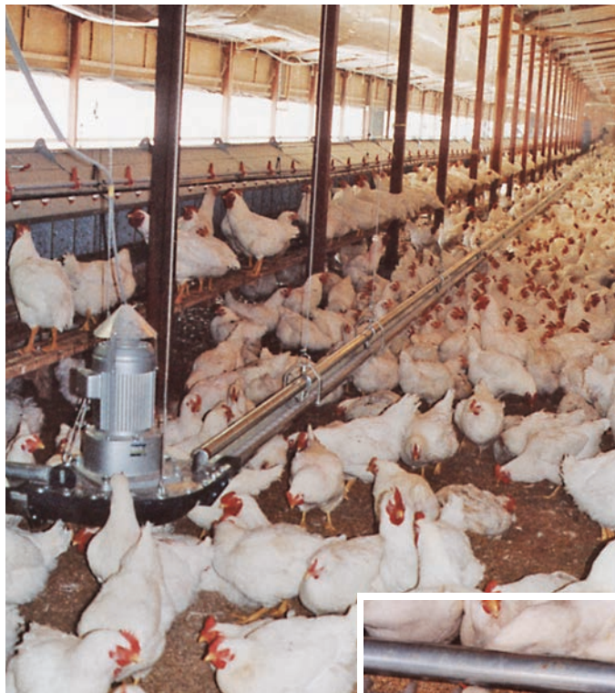
▲ケーブルフィーダー OC-60型（成鶏用）