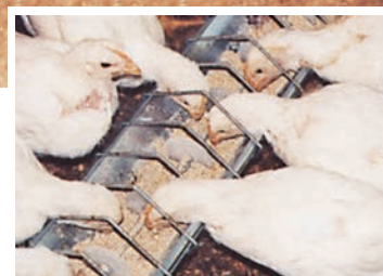
▲グリルガード・育成給餌